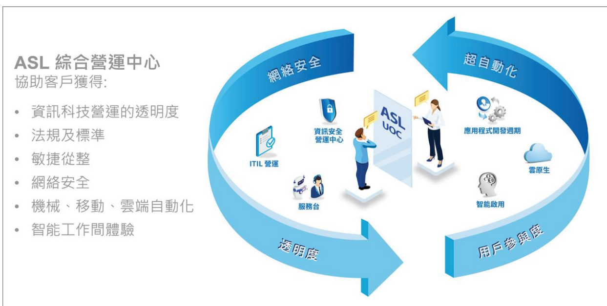
圖二：ASL 綜合營運中心貫穿營運，實現客戶業務對接。